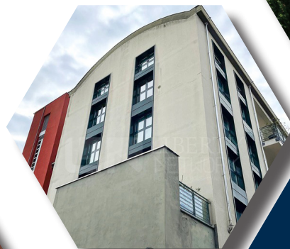
VIA ADELAIDE BONO CAIROLI