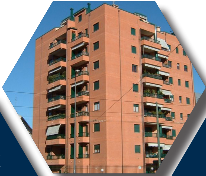
VIA LANCETTI VIA ULISSE SALIS