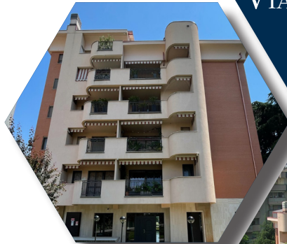
VIA FELICE VENOSTA