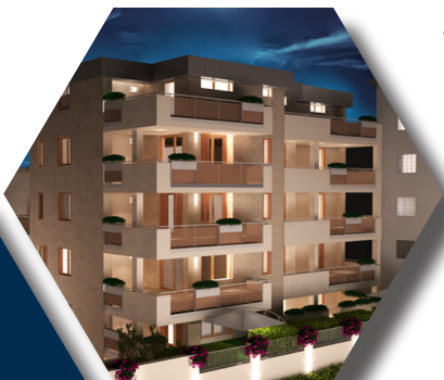
GREEN PLACE VIA PRIMATICCIO